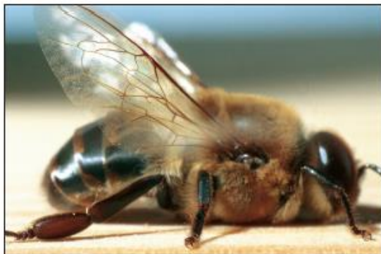
V čebelji družini je od 600 do nekaj 1000 trotov.