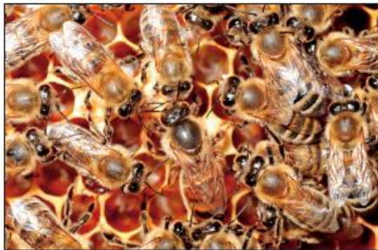
Matica zalega jajčece, obkrožena je z delavkami.

Jajčece iztisne iz zadka in ga z želom v pokončni legi pritrji na dno satne celice. Zalega v določenem redu. Zalegati začne na srednjem satu, nato pa zalego širi od sata do sata v obliki krogle. Vedno se vrača na srednji sat in poveča zalego za nekaj krogov. Ko se prva zalega v sredini izleže, čebele očistijo celice in matica jih znova zaleže.